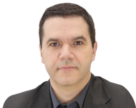
Lisandro Zambenedetti Granville Presidente da Sociedade Brasileira de Computação